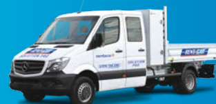
Benne double cabine avec coffre (6 places)