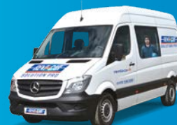
Utilitaire 12m 3 double cabine (7 places)