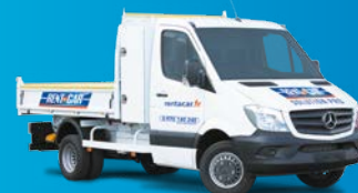
Benne simple cabine avec coffre (3 places)