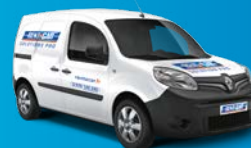
Utilitaire 3m 3 (3 places)