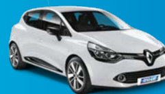
Voiture de société (2 places)

Au sein de notre large gamme de voitures et d'utilitaires, nous avons sélectionné 5 modèles de véhicules spécialement équipés.